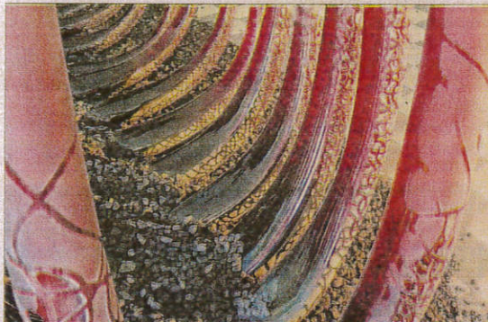
La barque se compose de trois parties, chacune de sept cornes et autant de moules différents pour les fabriquer.